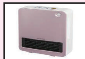
セラミックヒーター