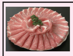
もち豚しゃぶしゃぶ用肉