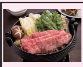
和牛すきやき用肉

団体戦 1位~3位、10位、20位、BB、ホタル (女性3名以上 上位3名のトータルネット)