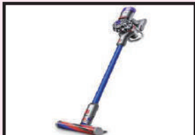
ダイソンクリーナー