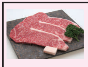
和牛ももステーキ